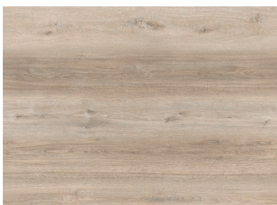
Ocean Oak AEYF001