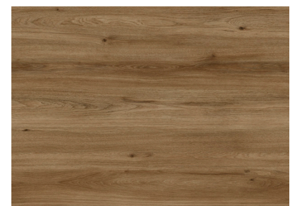
Mocca Oak AEYL001