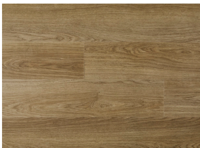
Manor Oak AEYE001

Amorim WISE • Monteres svømmende • Dim: 7,3x190x1225 mm