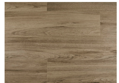
Quartz Oak AEYM001