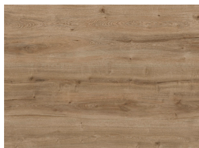
Field Oak AEYG001