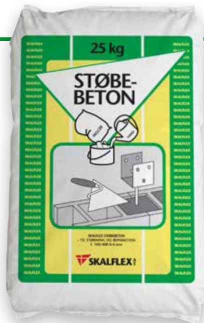
25 kg, DB-nr: 1265700