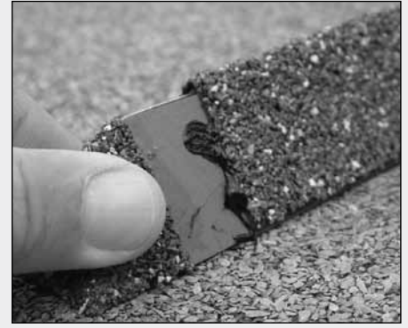
Endebeslaget skubbes på plads.