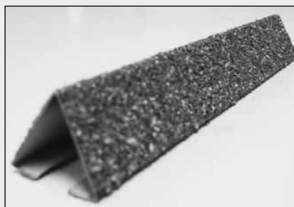
Trekantprofil, L-1,25 m, B-35 mm, H-32 mm