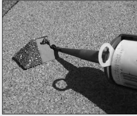
Endebeslaget påføres Isola Fugemasse som lim.