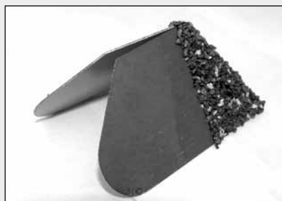
Endebeslag, skrå ende.