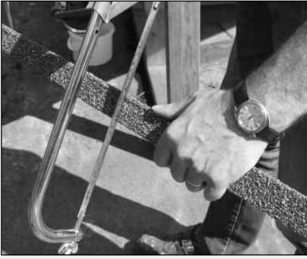
Sidste liste kappes i ønsket længde med nedstryger.