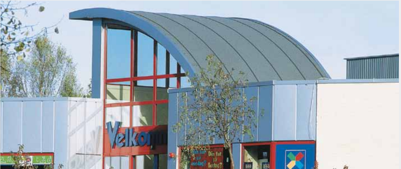
Sort profil-liste på skifergrå tagbeklædning giver en fin markering. Profil-listen placeres fortrinsvis i overlægget, som vist på billede.

Isola Profil-liste giver tagfladen en opdeling med lys- og skyggeeffekter. Profil-listen lægges fra rygning til tagfoden og giver et fint arkitektonisk præg. Isola Profil-listen kan svejses til tagfladen, som har Isola Mestertekk eller anden tagbelægning som underlag. Profilen er 9 mm høj og 25 mm bred. Afstanden mellem profil-listen kan, som udgangspunkt vælges frit. Ligges profil-listen i tagbeklædnings overlæg opnås en naturlig opdeling og større højdeforskel.